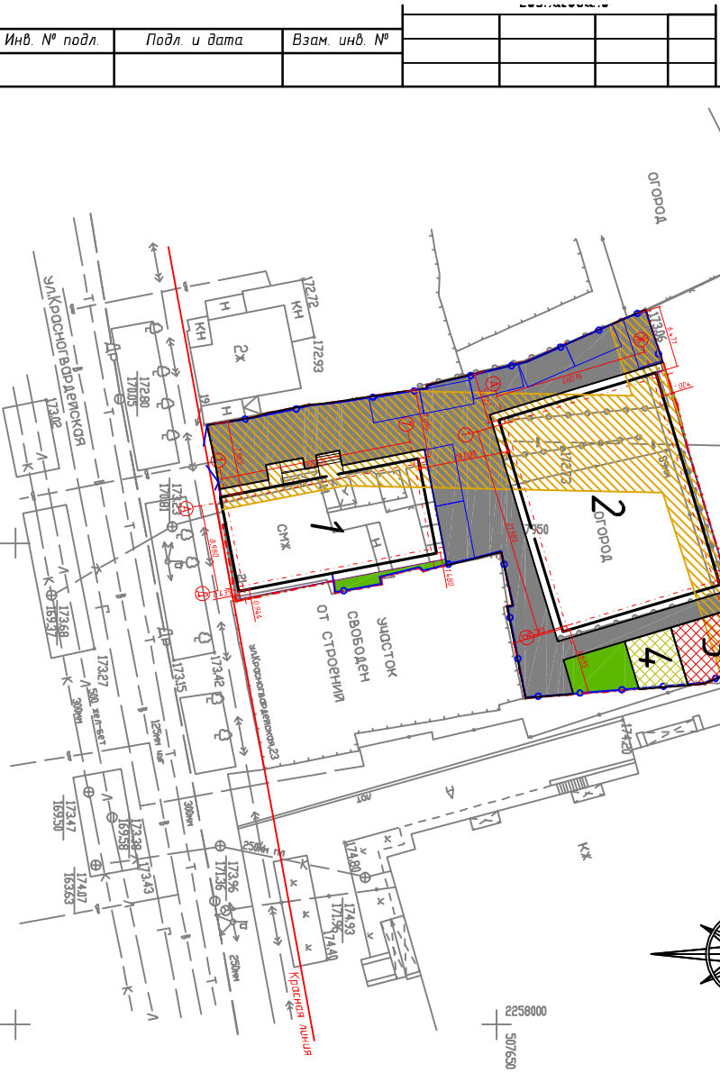
Схема планировочной организации земельного участка М 1:500